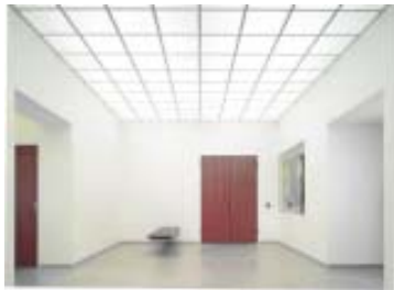
Milchüberfangglas, das ideale Material für Licht-Decken

F arbglass ist ebenfalls maschinengezogen, jedoch massiv eingefärbt. Durch die fast makellose Oberfläche ist es mit gewalzten (Import-) Farbglässern nicht vergleichbar. Damit Sie großzügig gestalten können, führen wir Farb- und Milchglas teils in großen Abmessungen. Beide Glasarten lassen sich bedingt härten bzw zu Verbundglas verarbeiten.