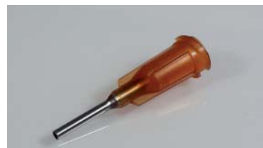
50 973 00 CONLOC Dosiernadel work needle