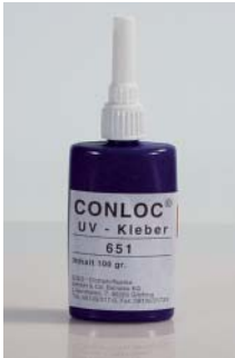
50 950 00 CONLOC UV-651, 20 g, glasklar/crystal clear