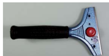
36 250 00 MARTOR Glasschaber "Profi" MARTOR Glass ductor "Profi"