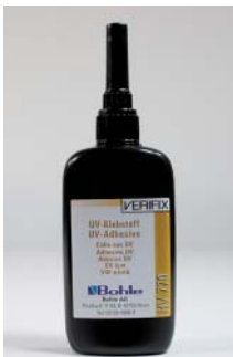
50 990 21 VERIFIX UV-Kleber HV 770, 100 g, glasklar / crystal clear