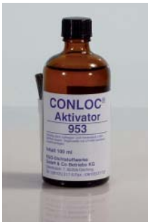
50 970 00 CONLOC 953 AKTIVATOR / ACTIVATOR für /for UV-665 + UV-682,