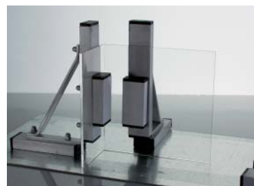
50 987 00 CONLOC Profi-Montageset CONLOC professional-fixing-set