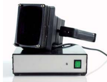
50 983 00 CONLOC UVA-Handstrahler CONLOC UVA-hand lamp