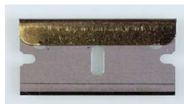
36 251 02 MARTOR Klingenschaber / Glass ductor simple