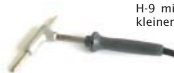
H-9 mit 110 Watt für kleinere Bleiarbeiten