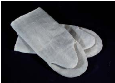
35 612 00 Paar Jutec-Hitzehandschuh Jutec Gloves pair

35 613 00 wie oben, Jutec-Handschuh bis 1100° C as above, Jutec mittens, pair, to 1100° C