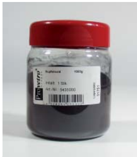
Kupferoxid 1000 g Copper oxid 1000 g