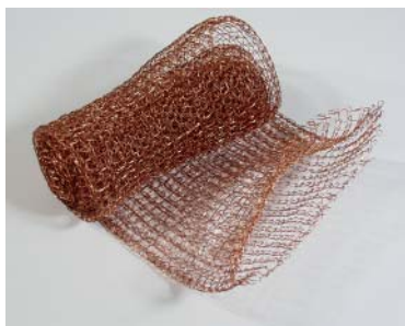
35 286 00 Kupferstrumpf Metal sock copper