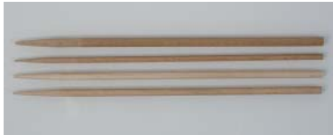
54 590 03 Pinselstiel / Brush handle, 3 mm