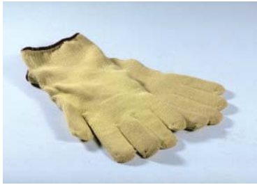
35 611 00 Paar Kevlar HandschuheTin-side Kevlar Gloves pair

35 611 00 Paar Kevlar Handschuhe, 5 Finger, 30 cm lang, bis 350° C Kevlar Gloves pair, 5 Fingers, 30 cm long, to 350° C