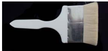
35 605 01 Trennmittel Pinsel, 121 mm Shelf Primer brush, 121 mm