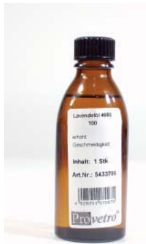
54 337 06 Lavendelöl / Lavender oil Nr. 4688, 100 ml