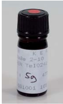
54 300 01 Glanzgold, flüssig, 10% Liquid gold 10% 2 g, gebrauchsfertig 2 g ready to use