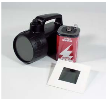
35 600 30 Stressometer mit Batterie Stressometer with Battery