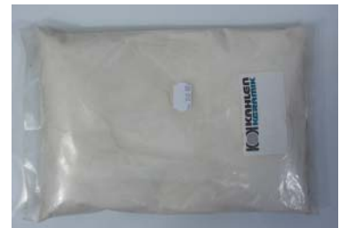
54 340 00 Gummi Arabicum, 1000 gr. Gum arabic, 1000 gr.