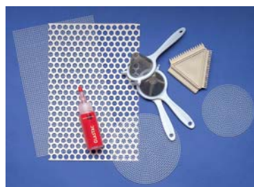
35 961 00 Bullseye Toolbox