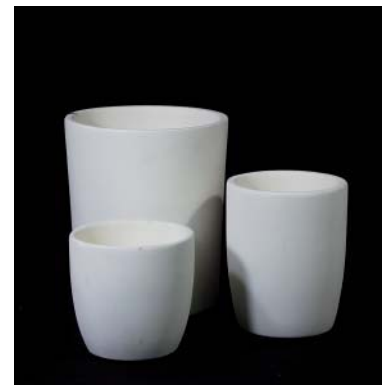
35 622 30 Glasschmelztiegel Glass melting pot