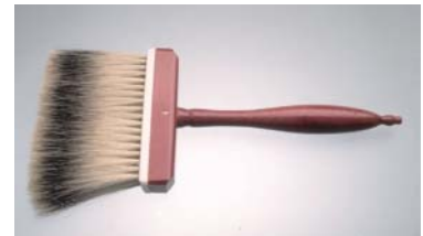
54 501 04 Dachsvertreiber / Badger blender 10,2 cm / 4"