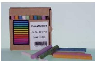
35 619 00 Fusing-Buntstifte / Fusing Color pencils