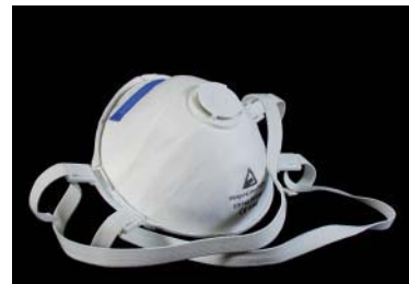
35 607 30 Feinstaubmaske mit Auslaß P3 Fine dust respirator P3 with valve