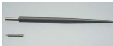
54 591 00 Zeichenfederhalter mit Feder Pen holder with pen