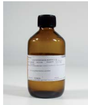
54 328 06 Lüsterverdünnungsöl, V18 100ml Luster Thinning oil, V18 100ml