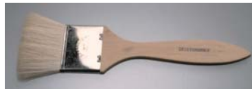
54 502 02 Flachpinsel 5,1 cm / Flat brush 2" Ziegenhaar / coat hair