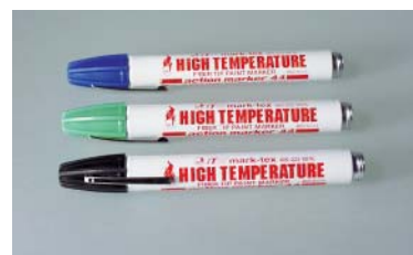
35 620 xx Lackstift, hitzebeständig, Marker, heat resistant