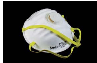
35 607 20 Feinstaubmaske P2, mit Auslaßventil Fine dust respirator P2, with valve