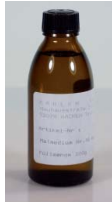
54 332 06 Medium Nr. 46, 100 ml