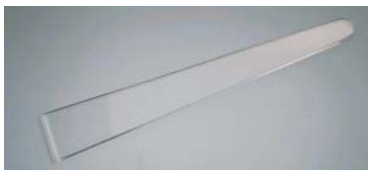
54 605 00 Plexiglasspachtel Plexiglass spatula, 30 mm