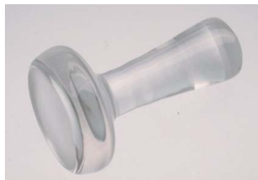
54 610 00 Farbreiber aus Glas / Glass muller