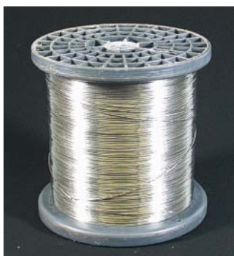
35 290 05 Kanthaldraht / Kanthal wire,