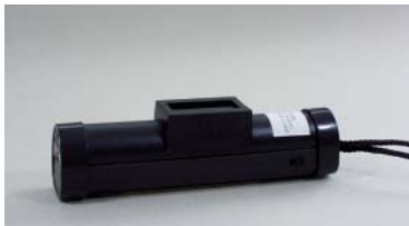
35 600 20 Zinnseitentester für Floatglas Tin-side detector for float glass

35 601 00 Badger Sprühpistolenset / Badger basic spray gun set 35 601 05 Badger Sprühpistolenschlauch/ Badger Vinyl Hose 35 601 90 Treibgas für Badger / Gas for Badger set