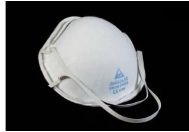
35 607 15 Feinstaubmaske P2 Fine dust respirator P2