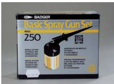
35 601 00 Badger Sprühpistolenset Badger basic spray gun set

35 513 00 Feuerfeste Schnur, 1260° C, VE 2m Heat resist rope, 1260° C unit: 2m