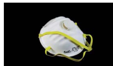
35 607 20 Feinstaubmaske / Fine dust respirator, P2, mit Auslaßventil / with valve