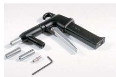
51 315 01 Strahlpistole für alle Drucksysteme Airgun for all pressure systems