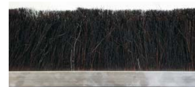
51 317 00 Roßhaarbürste Horsehair cabin brush