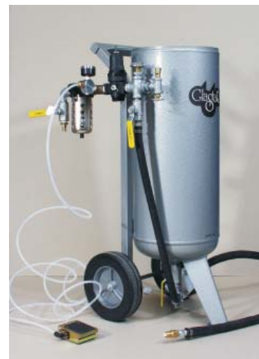
51 301 00 GLASTAR-Druckbehälter Pressure pot