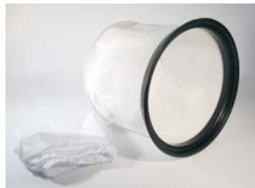
51 311 29 Staubfilter normal Dust filter, normal