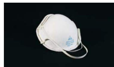
35 607 15 Feinstaubmaske Fine dust respirator, P2,