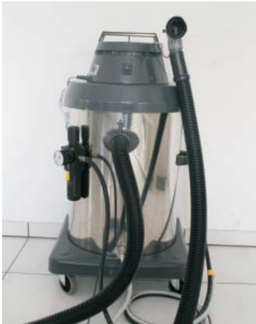
51 311 00 Mobile Syphon-Strahlanlage SANDMATIC Mobile Syphon blasting system