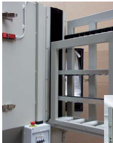
Innenansicht / Interior view

Großglasstütze für 5133000, rechts oder links Large glass supports for 51 330 00, right or left