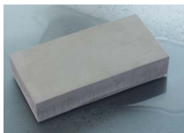
49 030 00 Schwamm für PROVETRO Griffschutz Sponge for PROVETRO Sandblasted surface protector