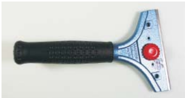
36 250 00 MARTOR Glasschaber / Glass ductor