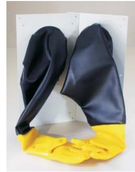
51 355 00 Adapterhandschuhe komplett mit Blech Sandblasting gloves with metal shield