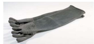
36 521 00 Gummihandschuhe / Rubber gloves