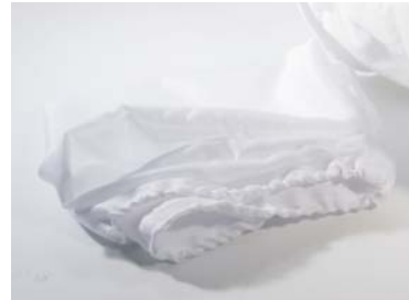
51 311 98 Feinstaubfilteraufsatz Fine particle filter adapter