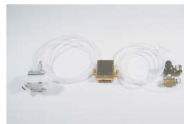
51 305 00 Fußschaltersystem Foot switch system