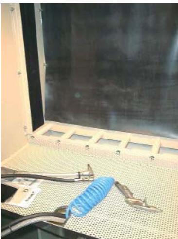
Innenansicht / Interior view