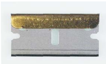
36 251 02 MARTOR Glasschaber / Glass ductor