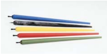
51 450 00 Schlingmesser-Set, 5 Stärken Parallel line cutter set, 5 sizes