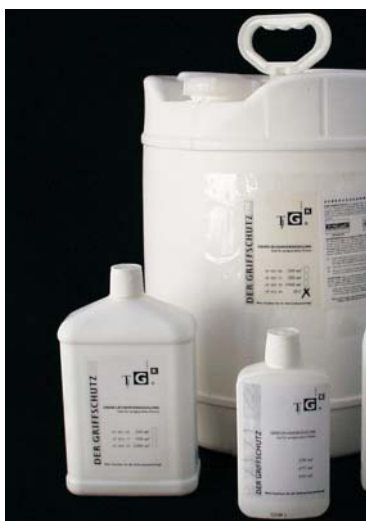
49 002 00 - 49 019 00 PROVETRO-Griffschutz PROVETRO Sandblasted surface protector